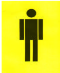
Männer über 15 Jahre MEN