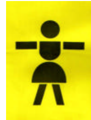
Mädchen 4-14 Jahre GIRL