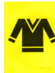
Pullover Westen POLLOVER

T-Shirts, Trainingsanzüge für alle Geschlechter