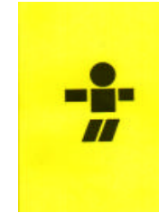
Kinder 0-4 Jahre INFANT