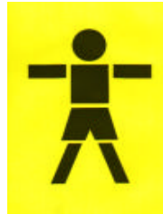
Buben 4-14 Jahre BOYS