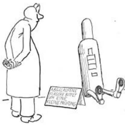
In- / Außerbetriebnahme

Gasart. Eine Gasflasche, über deren Inhalt irgendwelche Zweifel bestehen oder die in anderer Weise auffällig ist (Beschädigung, Feuereinwirkung, Spuren mechanischer Bearbeitung), darf nicht benutzt werden. Derartige Flaschen sollen klar gekennzeichnet und beim Gaselieferanten reklamiert werden. Vorgeschriebene regelmäßige Prüfungen der Gasflaschen werden vom Gaselieferanten veranlaßt. Der Anwender braucht sich um dieses Problem nicht zu kümmern und darf auch nach Ablauf der Prüffrist ohne zeitliche Begrenzung Gasflaschen entleeren.