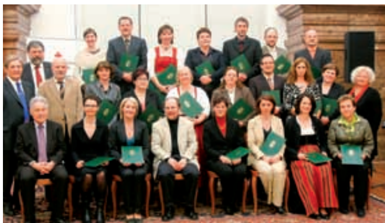
Stolz und erleichtert zugleich nahmen die Teilnehmer ihre Diplome entgegen.

Ausbildung wurde in Kooperation zwischen der Altenbetreuungsschule des Landes OÖ und dem OÖ Roten Kreuz erstmals abgehalten.