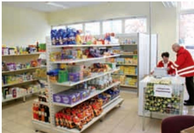
Der „MobiSom“ in Perg eröffnete im Dezember sein Verkaufslokal.

In Oberösterreich gibt es mehr als 100.000 armutsgefährdete Menschen, die es aufgrund ihrer finanziellen Möglichkeiten sehr schwer haben, ihren Alltag zu bewältigen. Mit der Etablierung von Sozialmarktstrukturen will das OÖ Rote Kreuz einen wichtigen Beitrag zur Armutsbekämpfung leisten. Vorzeigeprojekt ist der „MobiSom“ in Perg. Mit März 2010 folgt der Bezirk Steyr-Land und in den nächsten Monaten Eferding.