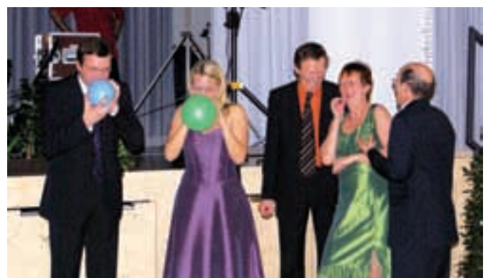
Eine originelle Idee beim Ball in Rohrbach, um die Losfarbe zu ermitteln.

Und der Bezirksball in Rohrbach machte durch seine wertvollen Tombolapreise auf sich aufmerksam.