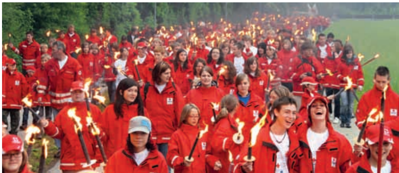
Jugend profitiert von freiwilliger Tätigkeit in Schule und Beruf.

Was die Experten der unterschiedlichsten Bereiche (ob Rotes Kreuz, Feuerwehr, Pfadfinder oder Fußballbund) einhellig unterstrichen haben, ist der Mehrwert eines freiwilligen Engagements. Mit anderen Worten: Jugendliche, die sich in ihrer Freizeit freiwillig einbringen, sind allgemein sehr aktive junge Persönlichkeiten, was sich einerseits auch in der Schule positiv auswirkt und andererseits auf dem Arbeitsmarkt als Positivum gewertet wird.