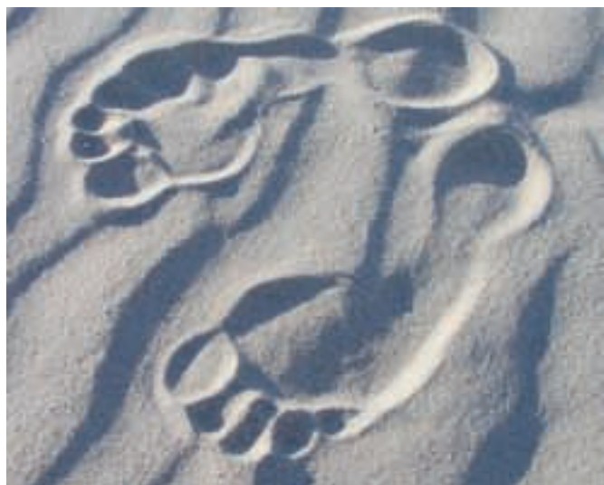
Jede Trauer braucht ihre Zeit.

Aufgrund der ständig steigenden Nachfrage nach Trauerbegleitung bietet das OÖ Rote Kreuz heuer wieder einen Trauerlehrgang an. Der Lehrgang umfasst elf Tage und startet am 26. Mai 2010 – der Auswahltermin wurde mit 22. April 2010 von 16.00 bis 20.00 Uhr im Rotkreuz-Zentrum Linz festgelegt.