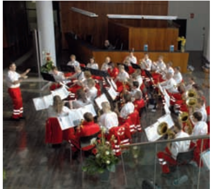
Ein herzliches Dankeschön gilt allen Rotkreuz-Musikern!