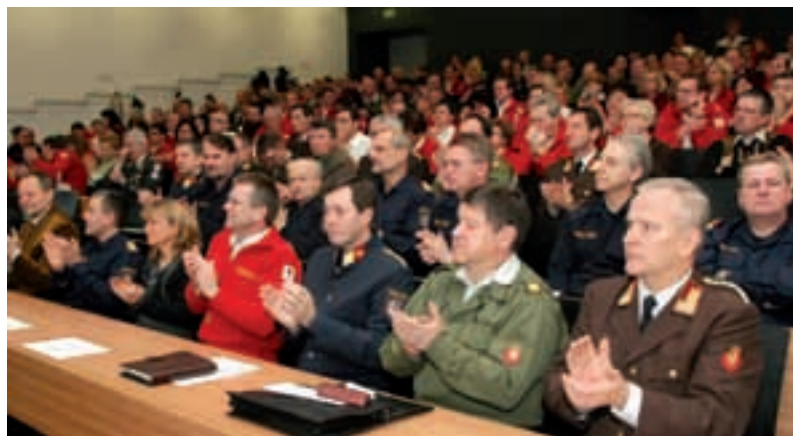
Vorträge und Fotos zur Fachtagung gibt's auf www.o.rotekreuz.at .