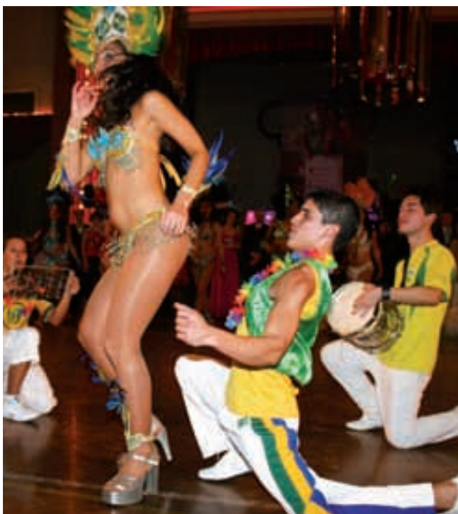
Lateinamerikanische Einstimmung beim Bezirksball in Perg.

Der Reinerlös des Bezirksballs in Perg unter dem Motto „Karibik“ kam beispielsweise zur Gänze den Erdbebenopfern in Haiti zugute.