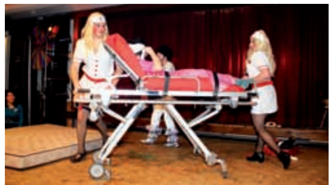
Die kranken Schwestern bei der Mitternachtseinlage des JRK-Balls St. Roman.

Der Jugendrotkreuz-Ball „Mamma Mia“ in St. Roman begeisterte die Besucher nicht zuletzt aufgrund seiner lustigen Mitternachtseinlage.