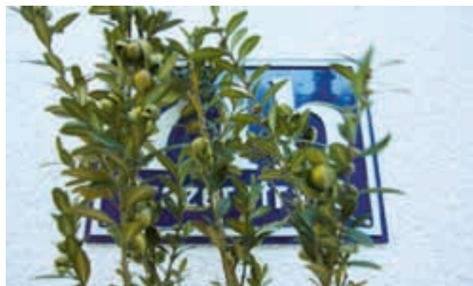
Verdeckte Hausnummern machen den Rettungskräften das Leben schwer.

Landesrettungskommandant Christoph Patzelt: „Weisen Sie die Menschen darauf hin und geben Sie Tipps, wie sie es besser machen können, z. B.: ‚Bringen Sie Ihre Hausnummer so an, dass sie von öffentlichen Verkehrsflächen aus gut einsehbar und lesbar. Große, gut lesbare Ziffern und eine entsprechende Beleuchtung sind außerdem sehr hilfreich. Und: Achten Sie darauf, dass Ihre Hausnummer und Straßenschilder nicht von Pflanzen überwuchert werden. Wenn möglich, schicken Sie in Absprache mit der Rettungsleitstelle jemanden auf die Straße, der die Rettungskräfte einweisen kann.“