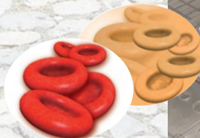
Blutkonserve nicht o.k.