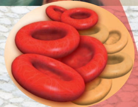
Blutspende (1 Spende = Hilfe für 2 Patienten)