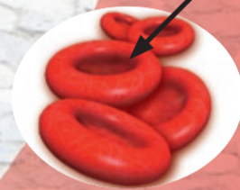
1. Rote Blutkörperchen