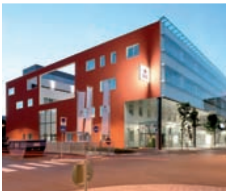
Die Blutzentrale in Linz

Die hochspezialisierten Labors und Einrichtungen der Blutzentrale Linz befassen sich aber nicht nur mit der Testung von Blutkonserven, sondern auch mit zahlreichen anderen Untersuchungen. Ein wesentlicher Bereich dabei