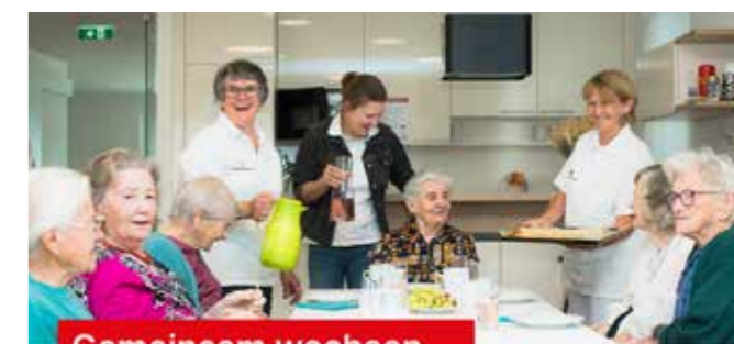
Gemeinsam wachsen ...

Natürlich freuen wir uns auch weiterhin, wenn ihr unsere Stellenausschreibungen über eure Kanäle oder in sozialen Medien teilt – auch das trägt wesentlich dazu bei, neue Kolleg:innen zu gewinnen. (lv burgenland)