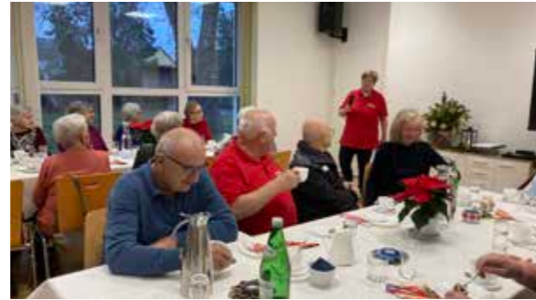
Club Miteinander Wallern