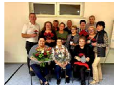
Club Miteinander Kohfidisch