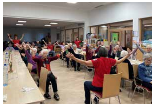
Club Miteinander Illmitz