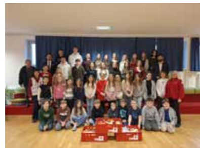
Gymnasium Oberpullendorf Fit4Future