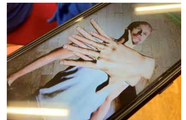
IM-Prepared-App: virtuelle Reanimation