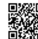
Erklärvideo zum Ablauf

Danke für eure Unterstützung. Oft reicht ein kurzer Hinweis an die richtige Person, um unser Team nachhaltig zu stärken.