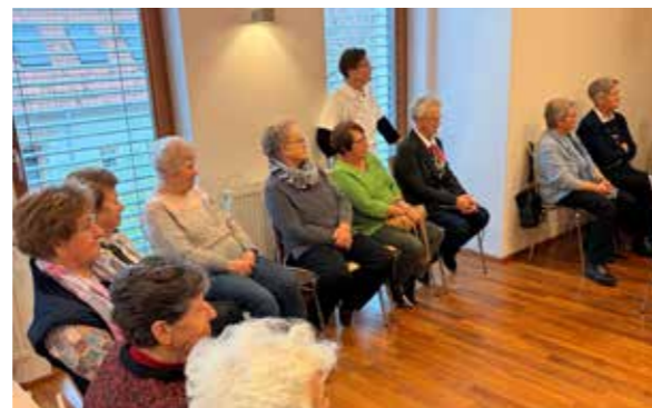
Club Miteinander Oggau