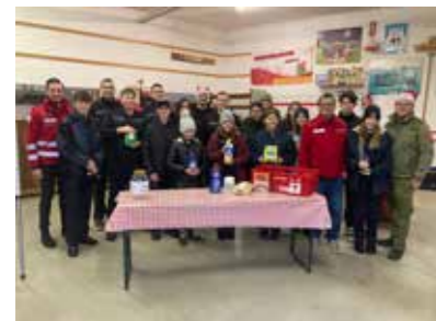
FF St. Martin

Danke für die Bereitschaft unserer Kinder und Jugendlichen, Menschen zu helfen und mit ihnen zu teilen. (angelika mileder)