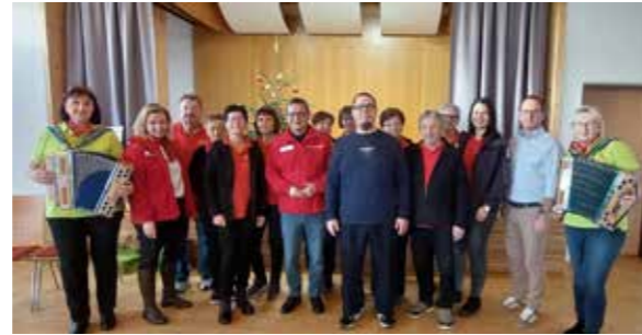
Club Miteinander Raiding